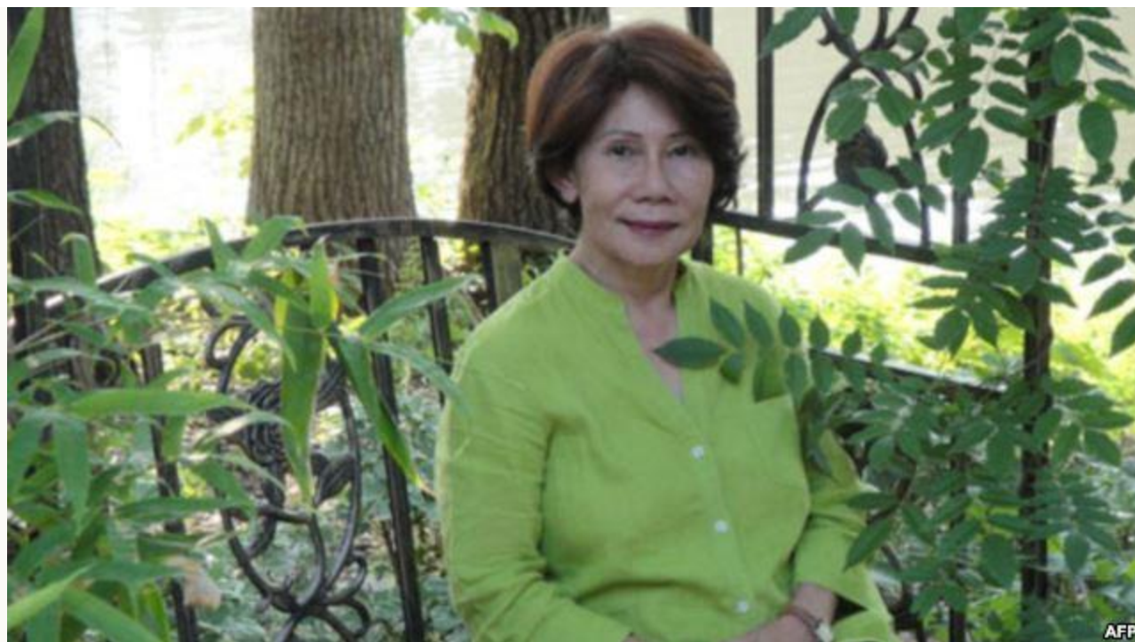
Tác giả NGÀN GIỌT LỆ RƠI ( A Thousand Tears Falling ) YUNG KRALL ĐẶNG MỸ DUNG